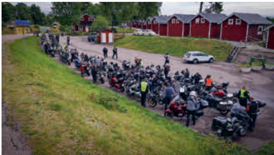
Bensträckare i Håverud vid Dalslands kanal.