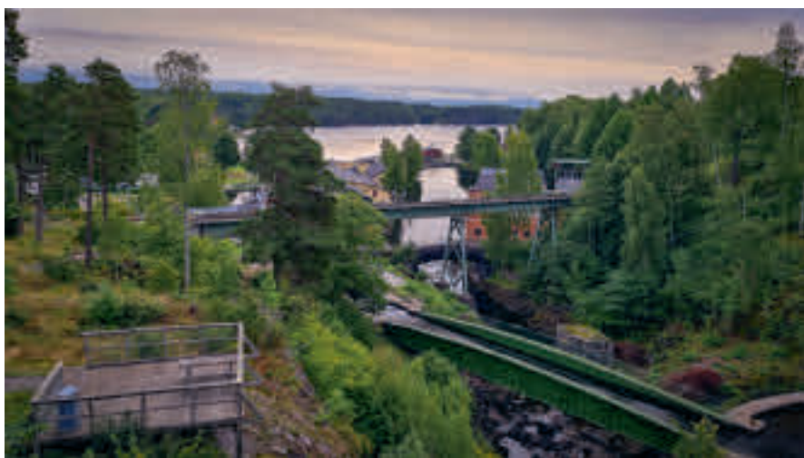
Akvedukten i Håverud.

Vänern ser vi inte mycket av, men vi passerar vackra insjöar med näckrosor. En bäck forsar nedanför vägen. Det är härligt att åka och bara njuta av natu- rens skönhet. Men det är viktigt att ha rätt kläder. Jag har blivit bönhörd och solen skiner för det mesta. Av det utlo- vade regnet faller inte en enda droppe på oss under hela resan. Temperaturen stiger till härliga 22 grader under da- gen, men det är lite svalt i luften så jag är tacksam över mina funktionsdugliga mc-kläder.