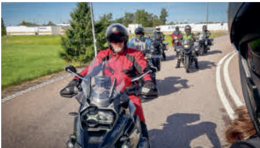
Gruppen håller samman.

Dessutom gillar jag att det är samling före varje start med instruktioner om vad nästa etapp ska innehålla. Nu har vi 90 km framför oss till Golfklubben i Hammarö där vi ska inta lunchen.